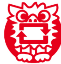
リサイクル認定資材 (ゆいくる)

ゆいくる制度とは、県内で排出される建設廃棄物を原材料として製造されるリサイクル資材について安全性や品質及び性能を評価・認定し、公共工事で積極的に利用することで天然自然の消費抑制及び最終処分場の延命化を図り、持続可能な資源循環型社会の実現を目指す制度です。